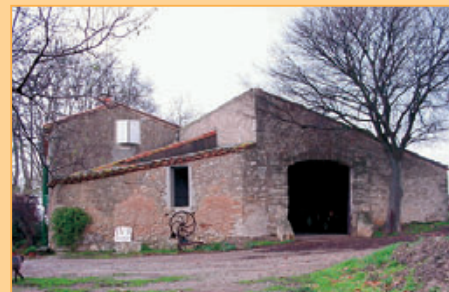
Ref. 11-1016 Biologisch wijndomein (42 ha.) met diverse gebouwen waaronder 2 comfortabele en ruim bemeten woonhuizen, een personeelswoning en een wijnmakerij. Gelegen op een Zuidwestelijk georiënteerde helling in de Languedoc. Prijs: op aanvraag