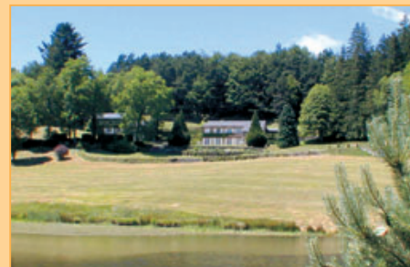
Ref. 15-4748 Zeer statig landgoed met optimale privacy en ruime mate van comfort, bestaande uit o.a. diverse zeer fraaie natuurstenen gebouwen, een privé-meer en 33 hectaren grond. Uniek. Vraagprijs: euro 1.100.000