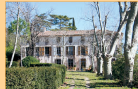
Ref. 15-5027 Rondom cour gebouwd 'domaine' met o.a. ruime 'maison de Maître', 5 appartementen, en div. bijgebouwen. Gelegen op parkachtig kavel (1,2 ha) met zwembad nabij een golfbaan en het centrum van een stadje met talrijke voorzieningen in de Languedoc. Vraagprijs: euro 1.075.000