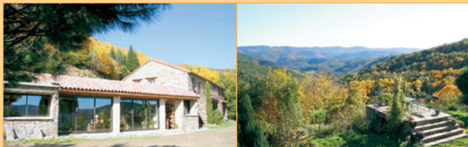
Ref. 15-4910 Gerestaureerde mas bestaande uit hoofdhuis (206 m 2 ), 2 gîtes (elk 90 m 2 ), diverse bijgebouwen en zwembad op 14 hectaren met adembenemd uitzicht op een paar kilometer afstand van stadje met voorzieningen in de Languedoc. Vraagprijs: euro 695.500