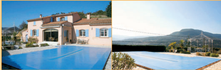
Ref. 15-5029 Degelijke villa in uitstekende staat van onderhoud op omheind kavel (2.450 m 2 ) met zwembad en adembenemd uitzicht in de omgeving van het stadje Lodève op zo'n 45 minuten afstand van de historische stad Montpellier. Vraagprijs: euro 398.000

Erkend Frans makelaar in bezit van 'Carte Professionnelle Transactions N° 11 1297'