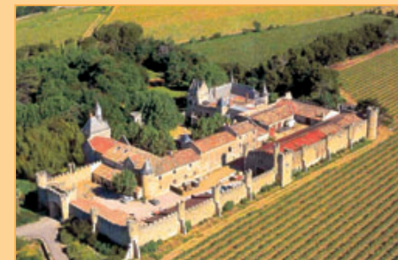
Ref. 11-1012 Gedeelte van kasteel historiek en sprookjesachtig, in de Languedoc op een minder dan een half uur rijden van de Middellandse zee. De toplocatie en de omvang bieden de mogelijkheid voor een rendabele investering op een zeer prettige en prestigieuze omgeving. Prijs: op aanvraag