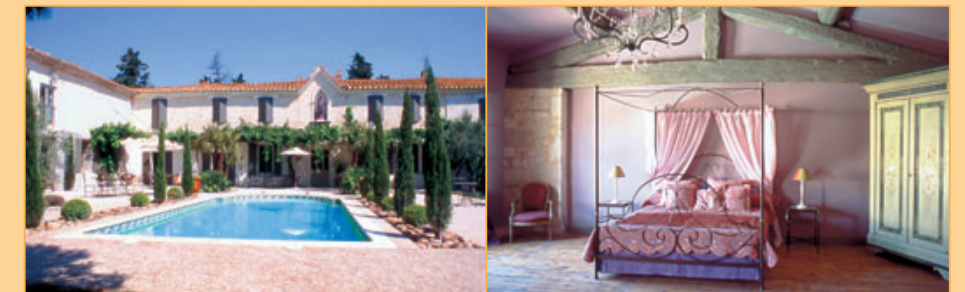
Ref. 11-1020 Voormalig U-vormig klooster op ruim 8 hectaren kavel met div. zeer ruime bijgebouwen (bebouwbaar oppervlak: 3.500 m 2 !). Het hoofgebouw is op Provençalse wijze gerestaureerd met een ruime mate van luxe en comfort. Ideale ligging op de grens van de Languedoc en de Provence, nabij Nîmes en Arles. Veel bestemmingen denkbaar. Evt. mogelijk om extra grond aan te kopen. Prijs: op aanvraag