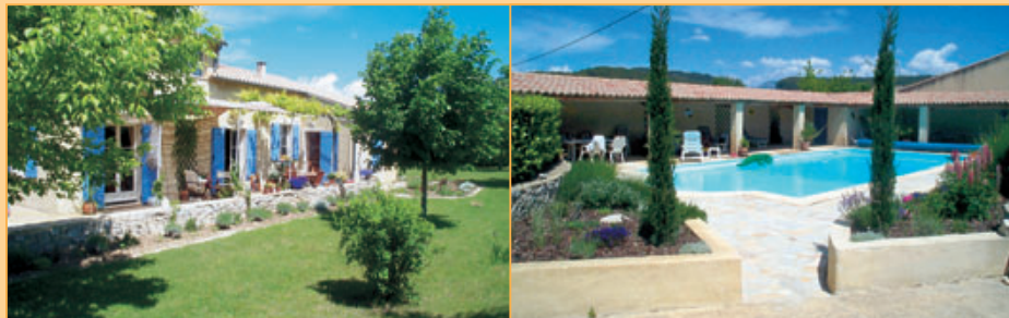
Ref. 11-1025 Fraaie en ruime Provençalse villa nabij het pittoreske Vaison la Romaine op omheind kavel met ruime overdekte terrassen en een zwembad. Vraagprijs: euro 535.000