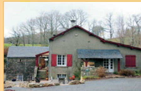
Ref. 15-4933 Landgoed van ca. 18 hectaren bestaande uit hoofdwooning, 2 'gîtes', paardenstallen, schuur en 12 campingplaatsen met sanitair. Gelegen in een natuurrijk gebied op ca. een uur afstand van de stad Béziers. Vraagprijs: euro 800.000