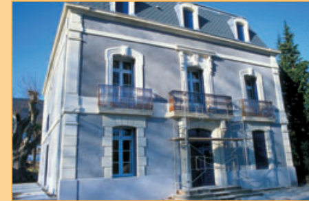
Ref. 11-1028 Statig 'Maison de Maître' , recentelijk en duurzame gerestaureerd, op 1.360 m 2 met ruime terrassen en zwembad, in het centrum van levendige stadje met voorzieningen Lamalou les Bains. Vraagprijs: euro 689.000