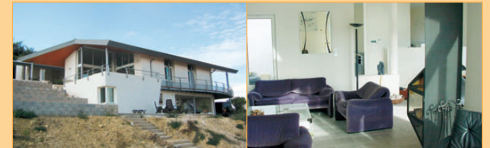
Ref. 11-1018 Moderne, onder architectuur gebouwde villa voorzien van een ruime mate van comfort met o.a. 2 gastenverblijven met vrije opgang, een fraai zwembad en een weids uitzicht op onderhoudsvriendelijk kavel (2.600 m 2 ) in de omgeving van het stadje Uzès. Vraagprijs: euro 742.000