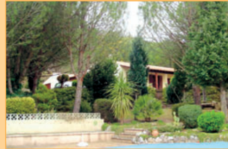
Ref. 11-1026 Gelijkvloerse villa met prachtige parktuin van ruim 3 hectare met een zwembad en een Zuidelijke oriëntatie nabij een dorp met voorzieningen in het Parc Naturel de Haut Languedoc. Vraagprijs: euro 350.000