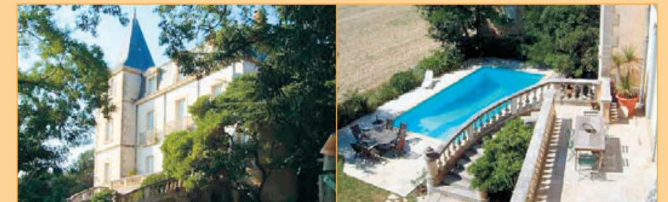
Ref. 11-1024 Smaakvol en luxe gerestaureerde 'Château de village' in de Languedoc (op minder dan een half uur rijden van de stranden aan de Middellandse zee) met ontelbare oorspronkelijke en waardevolle elementen, vrij uitzicht en een fraaie parktuin met diverse terrassen, een degelijk zwembad en diverse bijgebouwen. Vraagprijs: euro 785.000