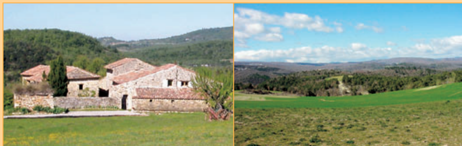
Ref. 11-1027 Natuurstenen mas met diverse bijgebouwen en talrijke oorspronkelijke details gelegen op een ruim kavel (20.300 m 2 ) op een heuvelrug met rondom vrij, weids en gevarieerd uitzicht over het speelse landschap van de Lubéron. De omvang en de ligging van het object maken diverse bestemmingen denkbaar. Vraagprijs: euro 650.000