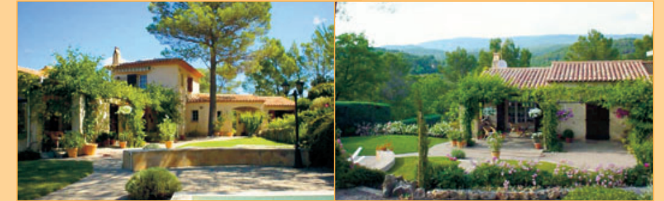
Ref. 11-1011 Sfeervolle Provençalse villa met zwembad met vrijstaand gastenverblijf en bijbehorend bassin op 1,3 hectaren, grenzend aan een beekje, met diverse olijf- en notenbomen en een weids en vrij uitzicht in de omgeving van Flayosc. Vraagprijs: euro 725.000